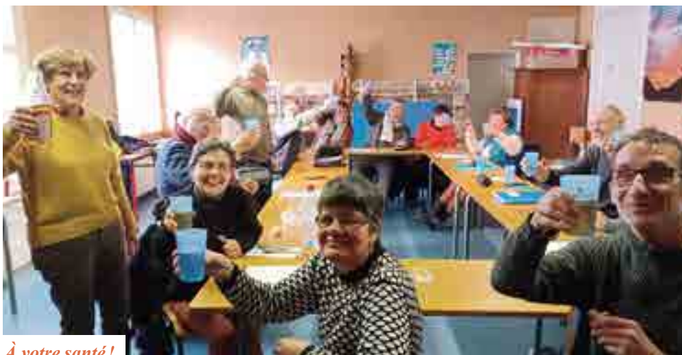
À votre santé!

Se déroulant au centre pastoral Pouzineau, les rencontres ont lieu une fois par mois. Elles commencent par l'accueil, le partage des nouvelles et le goûter. “Nous suivons principalement l'année