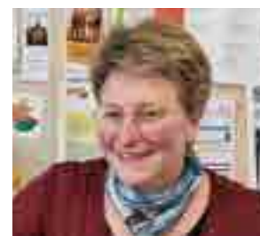
Bénédicte Morin, ministre reconnu à l'aumônerie des jeunes