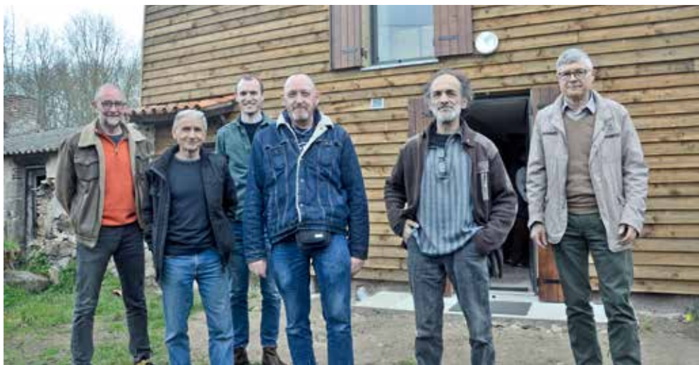
Une partie de l’équipe des bénévoles de l’association “Solidar’toit”.

La présence d’un tiers de confiance est essentielle lors des visites en binômes, pour établir une relation fraternelle et un suivi dans le temps.