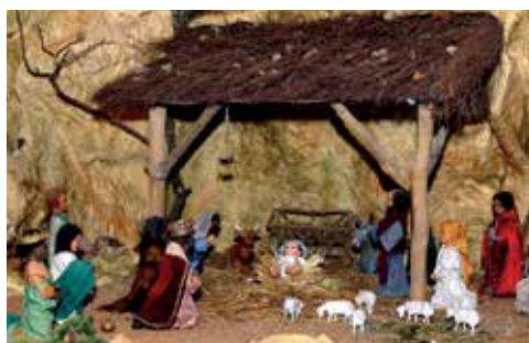
La crèche animée, un spectacle toujours fréquenté.

A Noël et pendant les fêtes de fin d'année, c'est le moment privilégié pour découvrir ou revoir le spectacle de la Crèche animée de Bressuire, 2 rue des Religieuses. Dans cette véritable fresque animée d'un village de Palestine d'il y a 2 000 ans, toutes les scènes s'enchaînent dans une synchronisation parfaite de son et lumière.