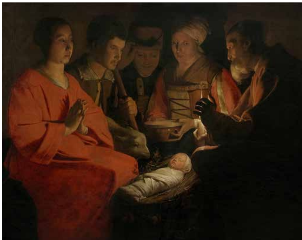
L'Adoration des bergers, tableau de Georges de La Tour.

Ce qu’ils veulent dire, c’est que les astres sont des créatures de Dieu et non des divinités à adorer comme le font les peuples