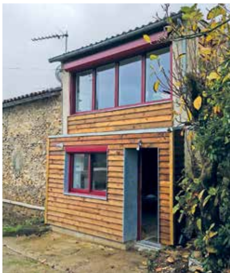
Un exemple de bâtiment revu et rénové.

Aux propriétaires occupants, il est proposé parfois un projet d’amélioration de la performance énergétique du logement. “ Pour cela, nous activons les aides financières de droit commun (ANAH, Département) et nous allons chercher les financements complémentaires auprès des acteurs privés (caisse de retraite, fondations, mécénat...) ”, indique un participant. Un réseau d’artisans, ainsi que l’ESIAM (Entreprise solidaire d’initiative et d’action des Mauléonais) et Atout Services sont mobilisés pour réaliser les travaux. Depuis 2018, quatre logements ont été rénovés et cinq autres vont l’être en fin 2023.