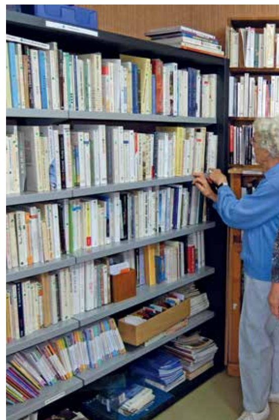
Le centre de documentation religieuse propose plus de 2000 ouvrages.

Pour les enfants, le tome 4 des “Aventures de Loupiot” qui s'ajoute à ceux que nous avons déjà; et “L'Évangile en BD” (9 albums).